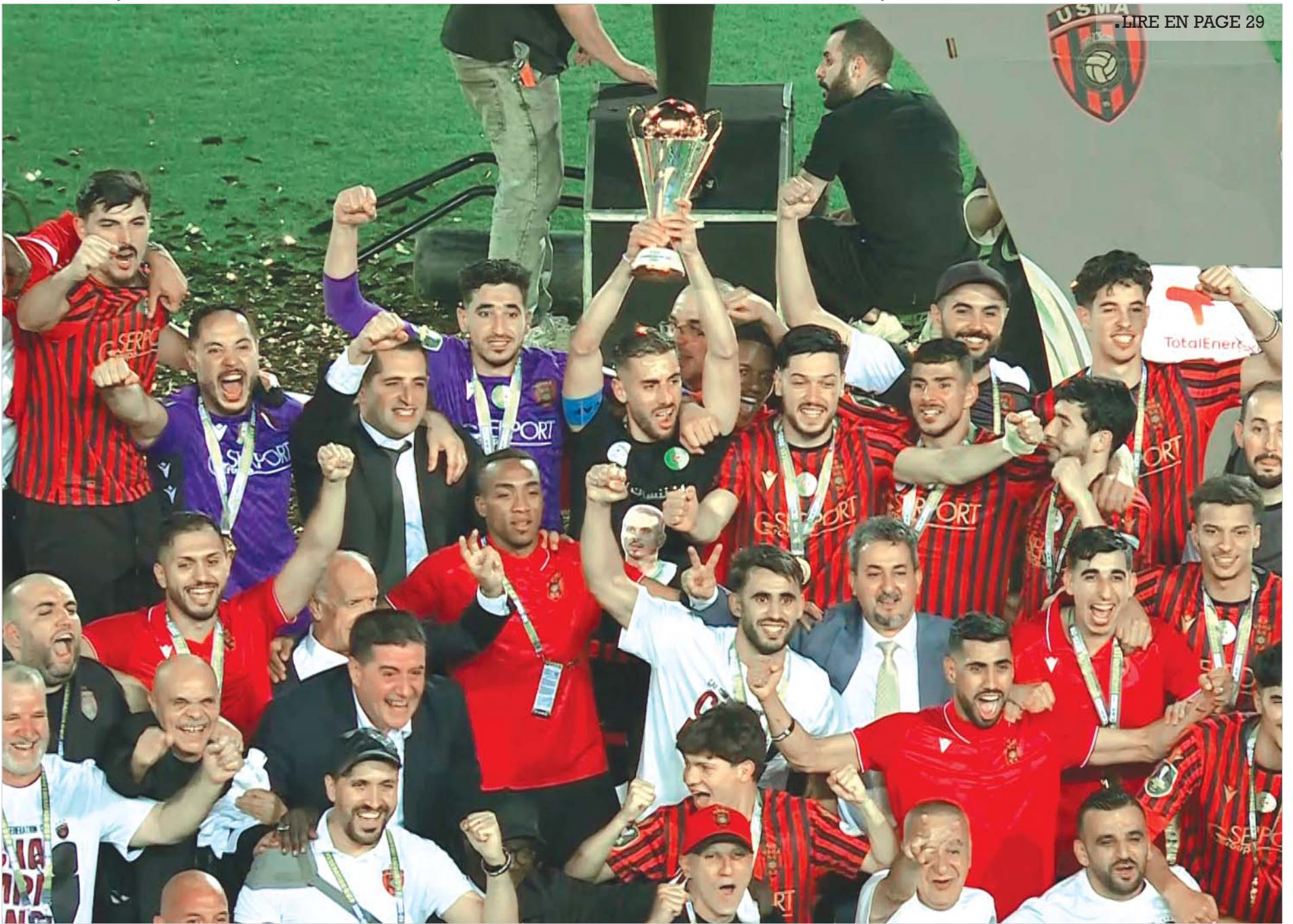
• LIRE EN PAGE 29

● Le président Tebboune : «Un grand honneur pour toute l'Algérie»