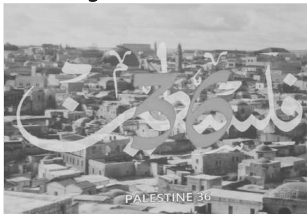
«Palestine 36» est une œuvre cinématographique et artistique que la ministre de la Culture et des Arts, M me Malika Bendouda, a apporté à la représentation diplomatique palestinienne pour la réussite de cette commémoration, avec, a-