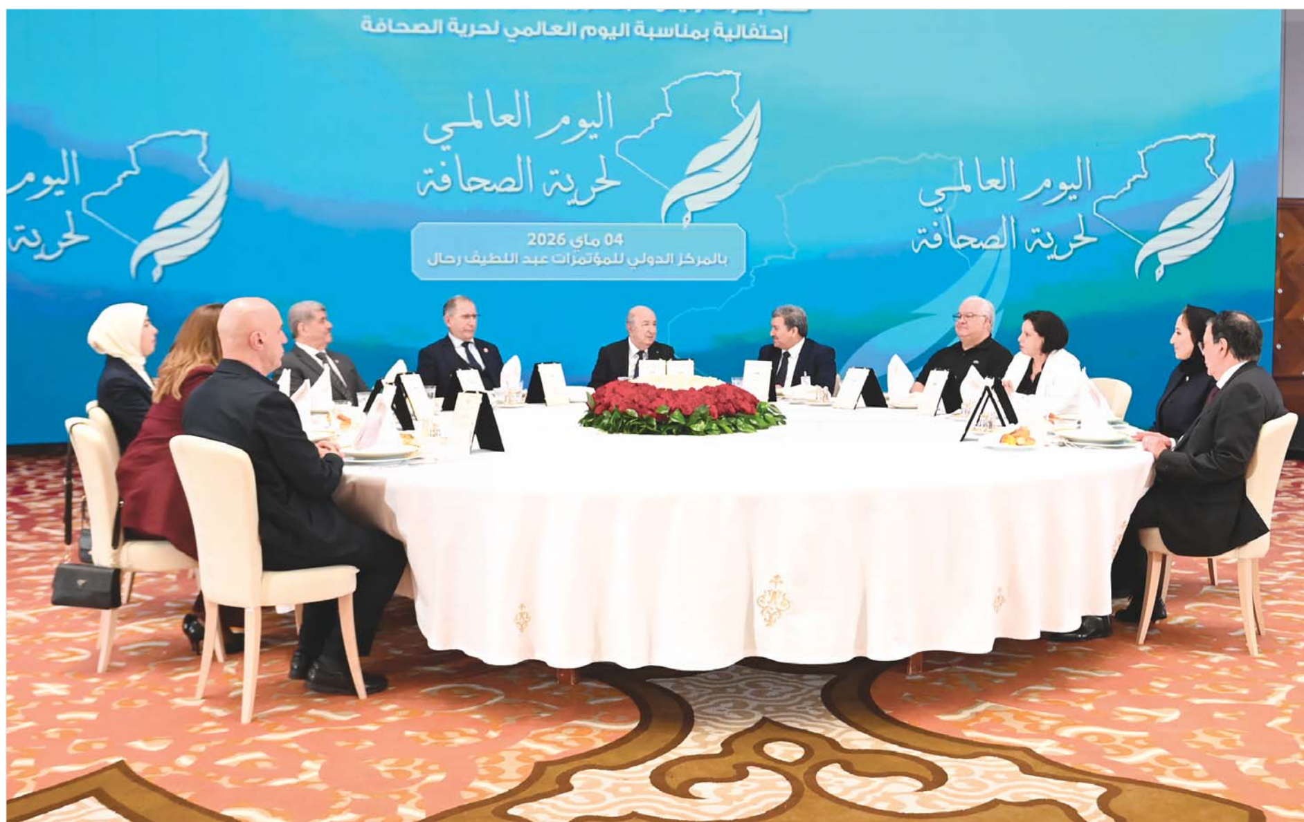
Le président de la République, Abdelmadjid Tebboune, a présidé, hier, au Centre international des conférences Abdelatif-Rahal à Alger, la cérémonie de célébration de la Journée mondiale de la liberté de la presse. La rencontre s'est déroulée en présence de hauts responsables de l'Etat, de membres du gouvernement, des responsables d'organismes nationaux et d'établissements médiatiques, de journalistes et des représentants de la presse étrangère accréditée en Algérie. ■ LIRE EN PAGE 3

8 e ÉDITION DE LA FOIRE DES PRODUITS ET DES SERVICES ALGÉRIENS À NOUAKCHOTT