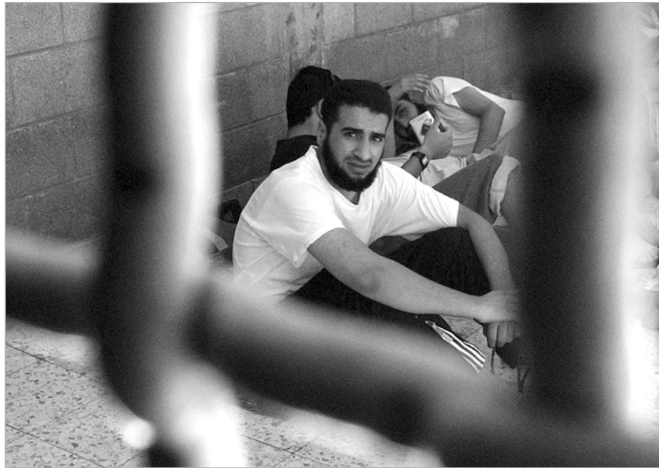
paletiniens. La déclaration des quatre pays européens indique que «le projet augmenterait considérablement les possibilités d'appliquer la peine de mort», soulignant que cette peine est considérée comme une forme de punition «inhumaine et humiliante» et n'a aucun effet

La présidence a souligné, dans ce texte, que ces lois et procédures ne réussiront pas à briser la volonté du peuple palestinien ou à saper sa détermination, ni ne les dissuaderont de poursuivre leur lutte légitime pour la liberté et l'indépendance, et établissant leur Etat indépendant avec Al Qods-Est comme capitale. La présidence palestinienne a apprécié la déclaration publiée par un certain nombre de pays européens, appelant l'entité sioniste à abandonner le projet de loi sur «l'exécution des prisonniers palestiniens». En effet, la Grande-Bretagne, l'Allemagne, la France et l'Italie, ont publié, lundi dernier au soir, une déclaration conjointe exprimant leur profonde préoccupation face à l'approbation par le Comité de sécurité nationale de la Knesset sioniste d'un projet de loi visant à exécuter des prisonniers