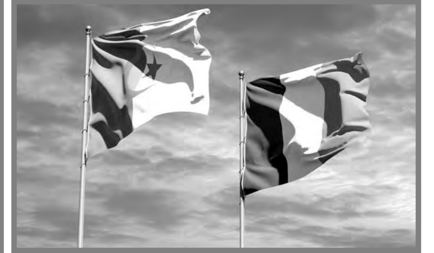
HORIZONS • Mardi 23 Décembre 2025